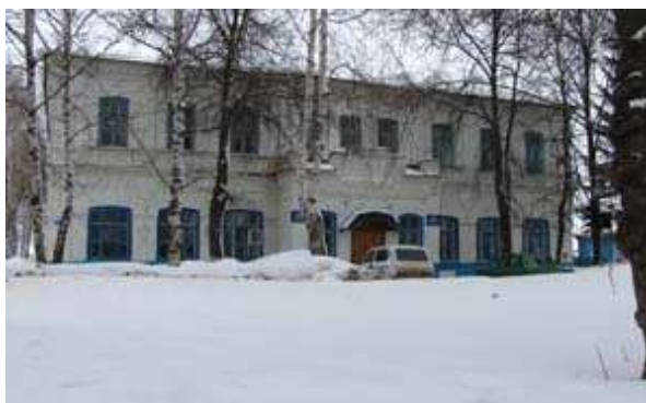
Здание женской гимназии. Улица Красноармейская, 77. Основное здание средней школы № 1.