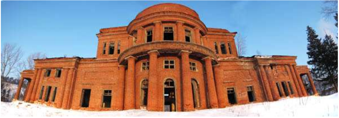
Деевский особняк. Село Знаменка. Начало XX века. Частное владение. Здание разрушается.

Церковь Дмитрия Салунского. Село Надеждино. 1799 год. Действующий храм. Дом, в котором жил чувашский поэт К. В. Иванов. Село Слакбаш. Построен в 1896–1914 годах. Дом-музей К. В. Иванова.