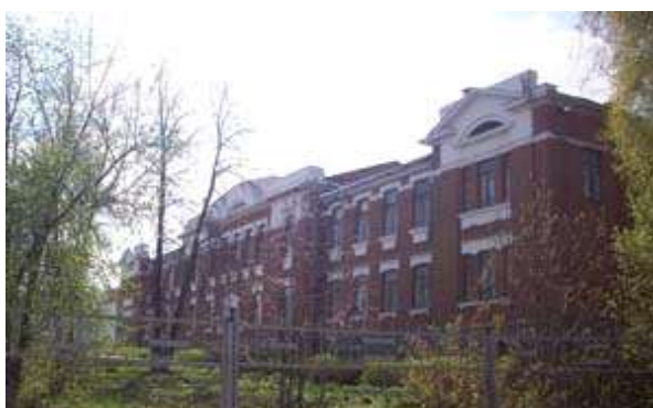
Реальное училище. Улица Пролетарская, 41. Построено в 1912 году. В настоящее время работает педколледж.