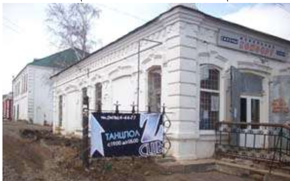
Торговые ряды. Улица Советская, дома №№ 30/2 – 30/10. Построены в 1901–1904 гг. Размещаются частные магазины, часть зданий не используется, подвергается разрушению.