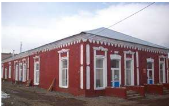
Синематограф «Иллюзион». Улица Советская, 19. Начало XX века. Частная собственность.