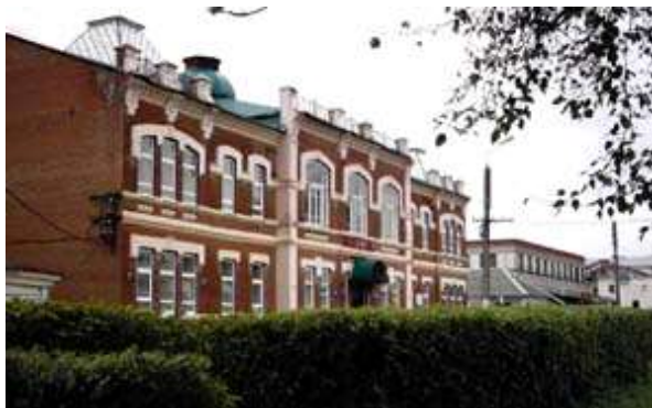
Земская управа. Улица Советская, 11. Здание 1912 года. Размещается филиал СамГАСУ.