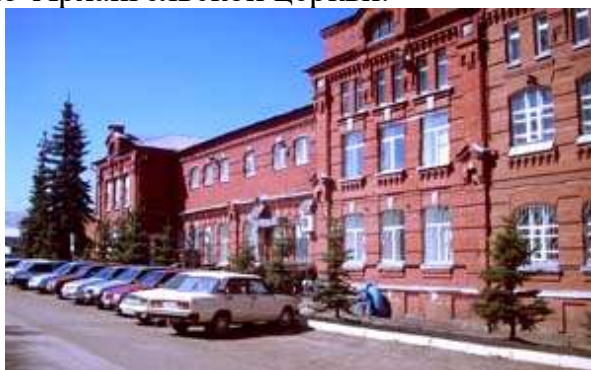
Винные склады. Улица Чапаева, 36. Возведены в 1895 году. Ликероводочный завод.