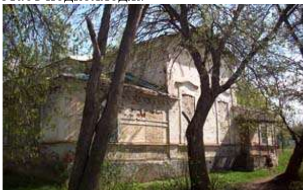
Здание Народного собрания. Улица Свободы, 7. Год возведения 1906. Районный Дом культуры.