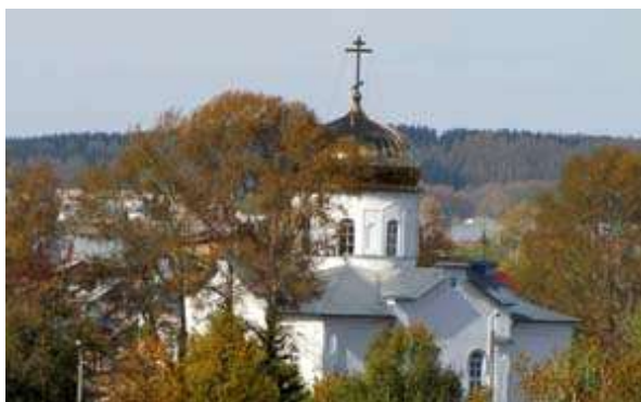
Никольский собор. Улица Советская, 54 б. Построен в 1897 году.